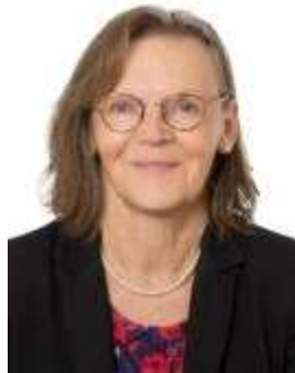
Angèle Prévile Sénatrice, Vice-Présidente de l'Office