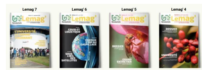
Tableau de bord CALAMEO